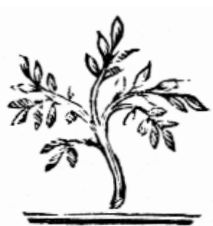
Rameau d'olivier, ornement de la p. 4 de couverture de La Lyre (Genève, 1824), probablement dessiné par A. Calvos.

odes, au manuscrit de l'Iliade conservé à la Bibliothèque publique, 45 peut-être à ce projet de dictionnaire complet de la langue grecque, que Calvos a consacré l'essentiel de sa vie à Genève.