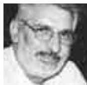
Του Γιώργου Ζ. Ζαχαριάδη

ΟΙ ΚΑΤΟΙΚΟΙ των νησιών του Αιγαίου δεν πήγαν την Κυριακή των ευρωεκλογών στις παραλίες για να μαυρίσουν. Προτίμησαν τις κάλπες για να μαυρίσουν τη Νέα Δημοκρατία. Με σημαιοφόρο την Κρήτη, η Δωδεκάνησος, οι Κυκλάδες, η Χίος, η Σάμος, η Μυτιλήνη, αλλά ακόμη και όλα τα Ιόνια Νησιά έδωσαν ένα σκληρό μάθημα στην κυβέρνηση για όσα