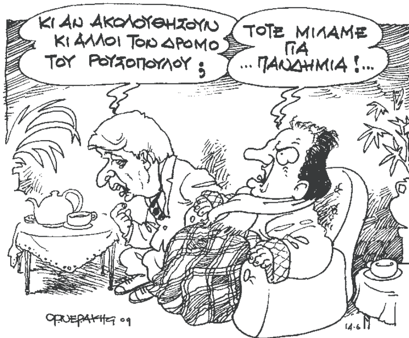
Του Σπύρου Ορνεράκη

Υπάρχει και το πρόβλημα των λαθρομεταναστών που κατά κύματα φτάνουν στα νησιά, χωρίς μέχρι τώρα να έχει ληφθεί κανένα απολύτως μέτρο από την κυβέρνηση. Είναι χαρακτηριστικό ότι την ημέρα των ευρωεκλογών στο Αγαθονήσι οι λαθρομετανάστες που βγήκαν στο νησί ήταν περισσότεροι από τους...ψηφοφόρους, ενώ στη Σύμη οι ιδιοκτήτες εκατό και πλέον κωπότερων και θαλαμηγών στο λιμάνι βλέπουν να κυκλοφορούν μόνο λαθρομετανάστες.